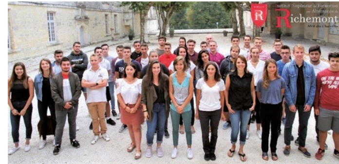
BTSa Viti et TCVS