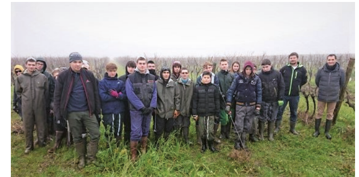
Bac Pro CGEA et VITI