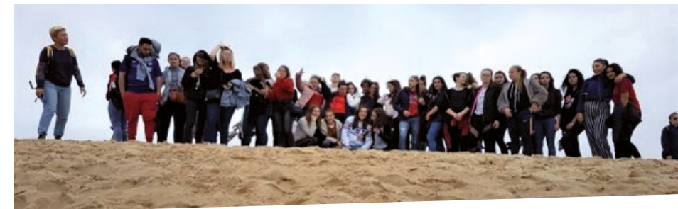
Journée intégration en terminale SAPAT