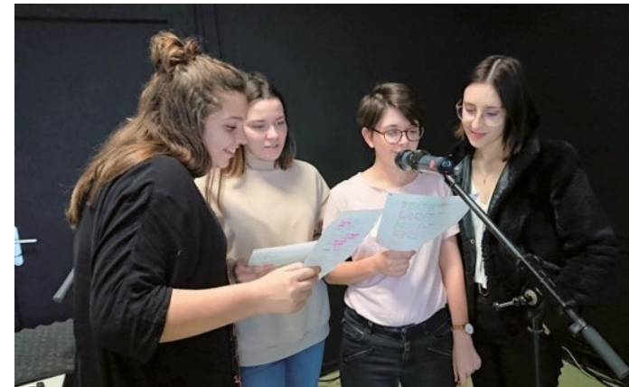
Animation en Bac Pro SAPAT