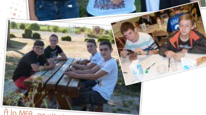
À la MFR, on vit et on grandit ensemble.

Je n'avais jamais été en internat. Avant d'arriver j'avais une petite appréhension mais ça ne m'a pas dérangé d'y aller. Mon appréhension est vite passée car c'est cool l'internat, car on est avec ses amis, on rigole, on parle, on est entre nous. J'aime bien l'échange qu'il y a avec les formateurs.