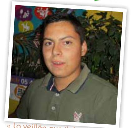
« La veillée que j'ai préférée était la veillée de Noël. »

- Les veillées que j'ai faites étaient des animations comme Noël, des films, des jeux collectifs et un peu de tout. Les veillées d'intégration servaient à apprendre à se connaître et à se faire de nouveaux