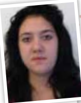
Sorenza CAPa SAPVER 1

Je n'avais jamais été en internat. Avant d'arriver j'avais une petite appréhension mais ça ne m'a pas dérangé d'y aller. Mon appréhension est vite passée car c'est cool l'internat, car on est avec ses amis, on rigole, on parle, on est entre nous. J'aime bien l'échange qu'il y a avec les formateurs.